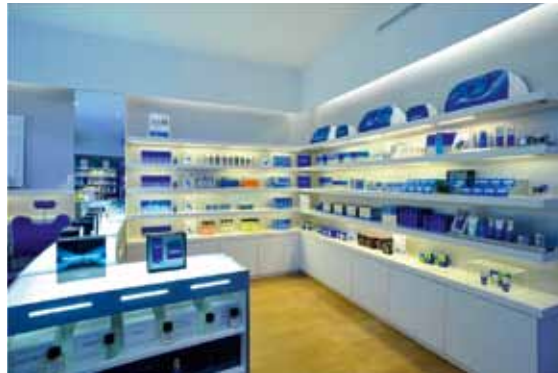
PARIS Francs-Bourgeois (1996)