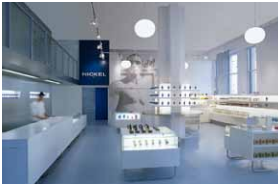
NEW YORK (2001)