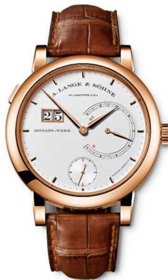
La nouvelle LANGE 31 dans un boîtier en or rose

Un dispositif à force constante situé entre le double barillet et l'échappement garantit que le balancier reçoit une quantité d'énergie toujours constante toutes les dix secondes, indépendamment de l'état de tension des ressorts.