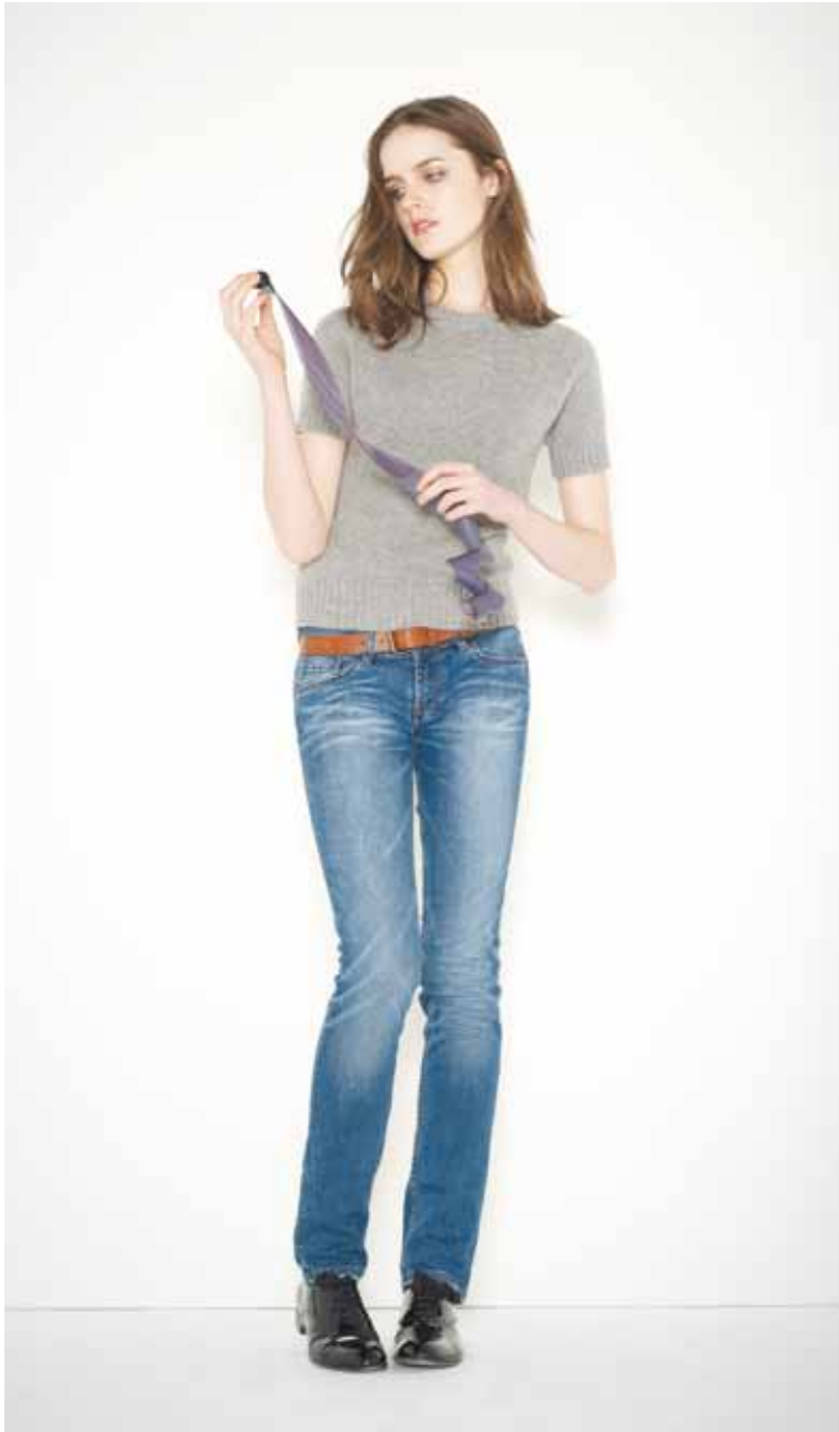
16 Pull Georges en geelong - Georges geelong lambswool jumper Jeans Boy Slim en denim used - Boy Slim used denim jeans Ceinture Beckett en cuir - Beckett leather belt