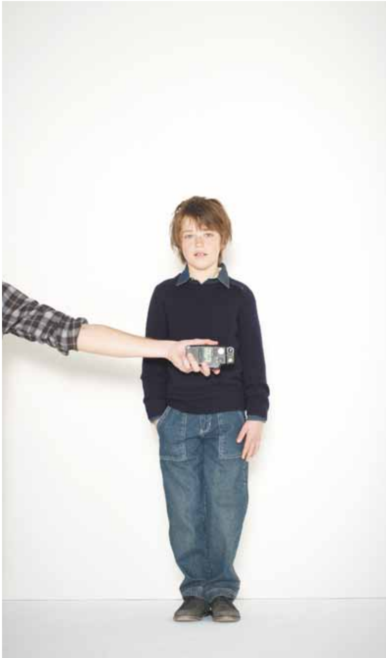
47 Pull Wilson en laine mélangée - Wilson melanged wool jumper Chemise Follain en coton - Follain cotton shirt Jeans Romain en denim used - Romain used denim jeans