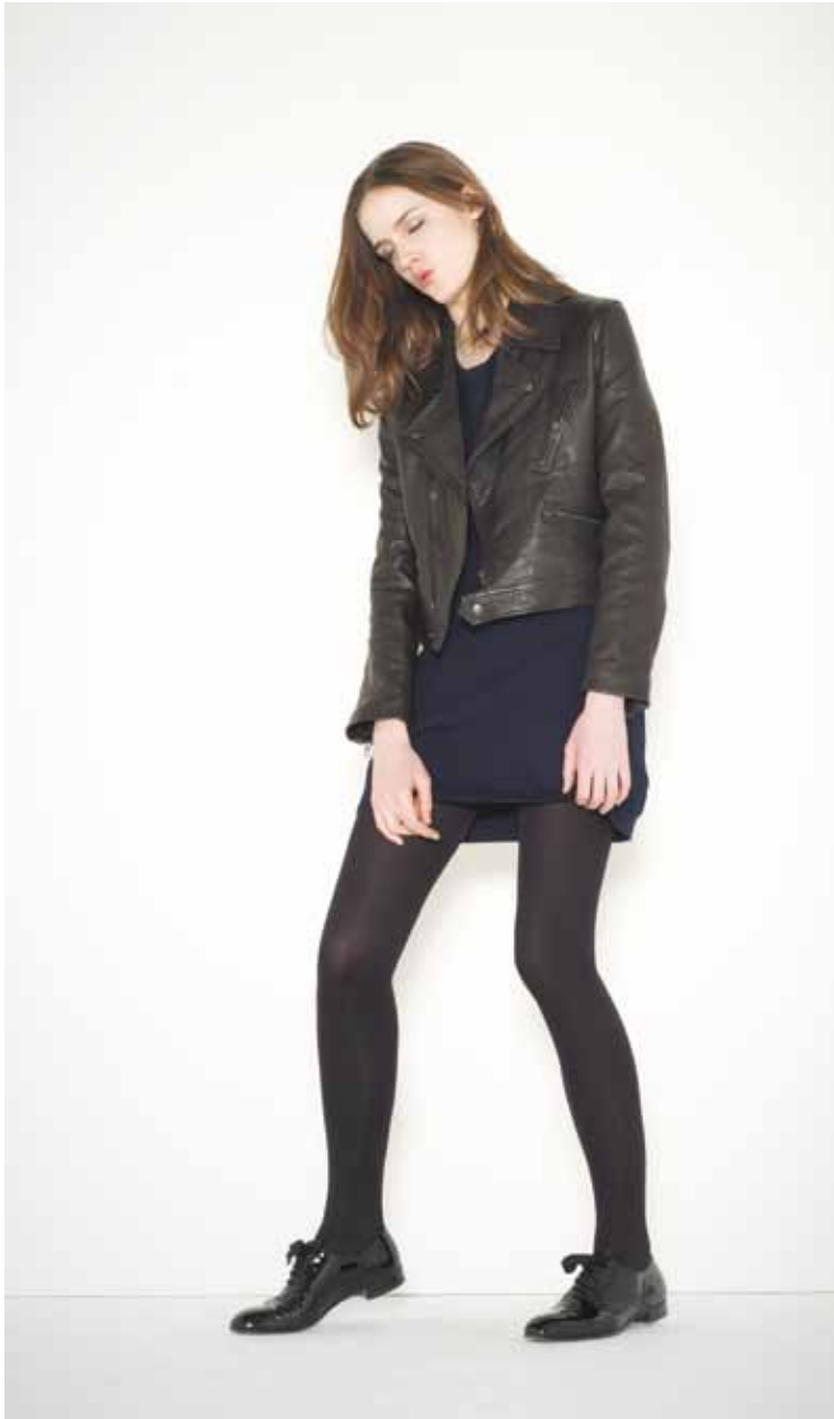
10 Perfecto Loft en cuir - Loft leather perfecto Robe Odile en coton bio - Odile Organic cotton dress