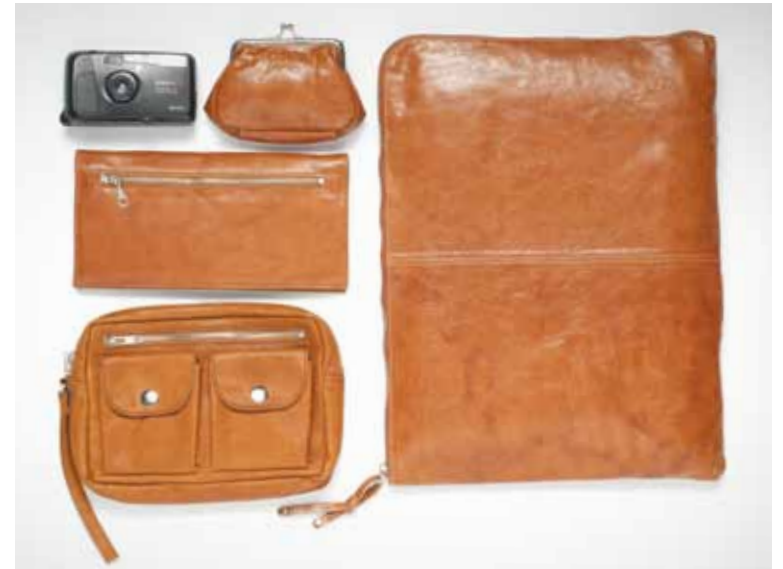
Ligne Gilson en cuir - Gilson leather line 6