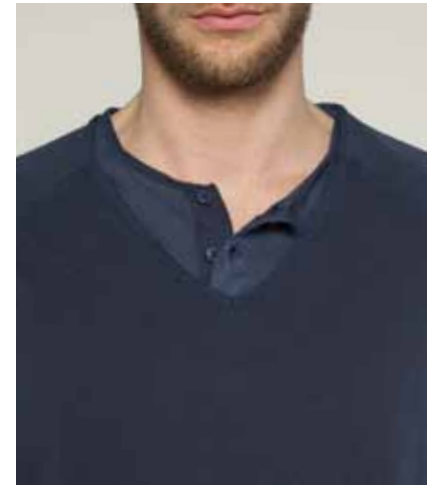
T-shirts & cardigans en coton surteint vintage - Vintage overdye cotton t-shirts & cardigans