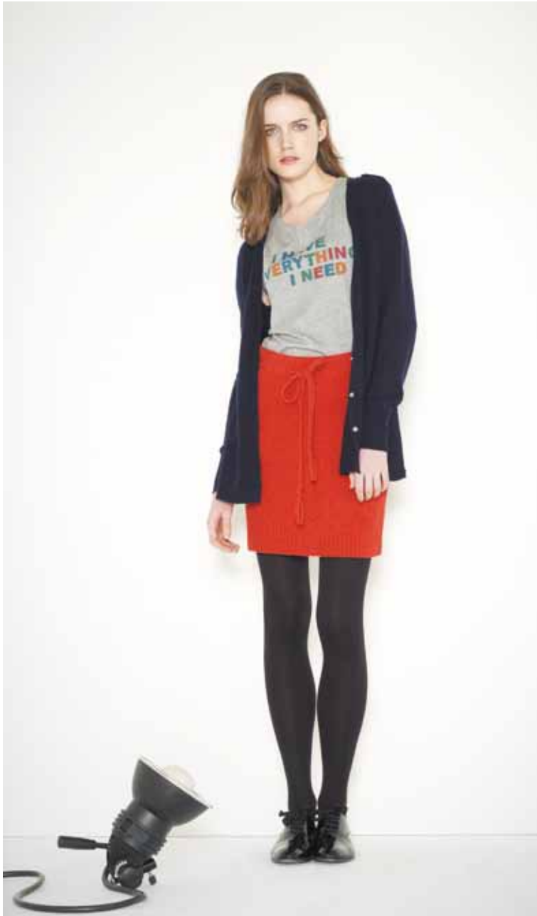
14 Cardigan Damien en cachemire - Damien cashmere cardigan T-shirt Need en coton imprimé - Need printed cotton t-shirt Jupe Simiot en shetland & cachemire - Simiot cashmere & shetland wool skirt