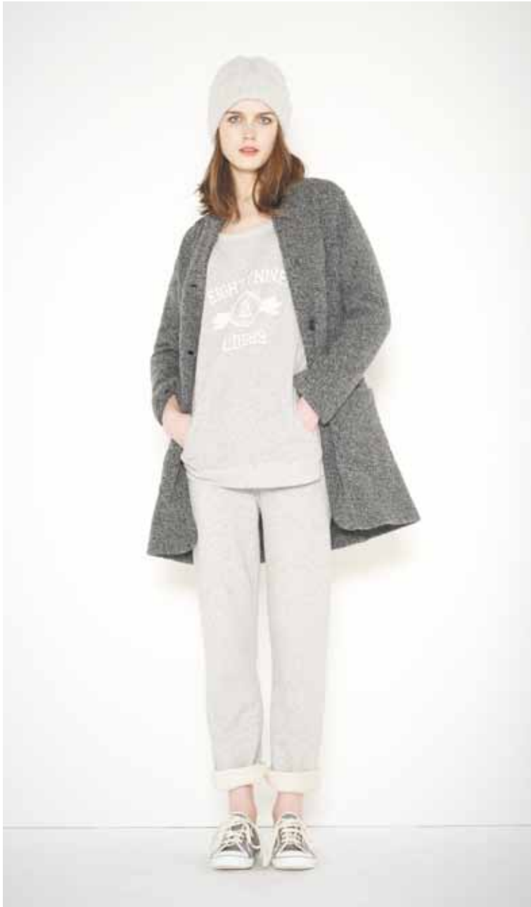
18 Veste Work en laine bouillie - Work boiled wool jacket Sweat Drieux en molleton - Drieux French Terry cotton sweat shirt Jogging Drieux en molleton - Drieux French Terry cotton jogging Bonnet Casino en cachemire - Casino cashmere cap