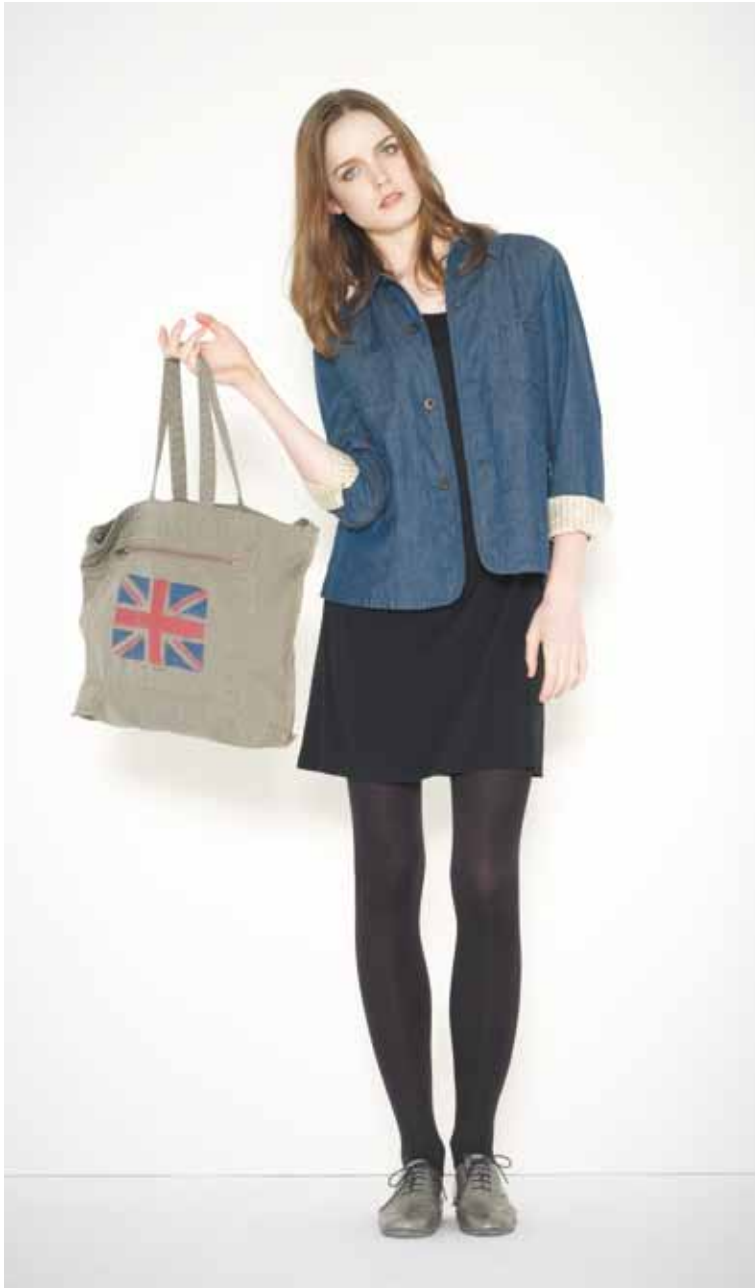
4 Veste Prévert en denim - Prévert denim jacket Robe Varenne en coton viscose flammé - Varenne slub cotton viscosis dress Sac Freedom en toile - Freedom canvas bag