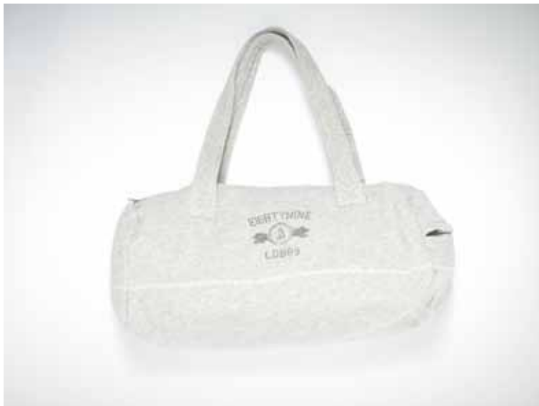
5 Sac Salomon en molleton - Salomon French Terry cotton bag