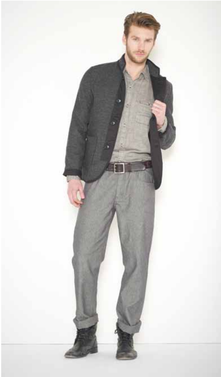
24 Veste Vidal en laine - Vidal wool jacket Chemise Coburn en chambray - Coburn chambray shirt Pantalon Henry en chambray - Henry chambray trousers Ceinture Calet en cuir gravé - Calet engraved leather belt