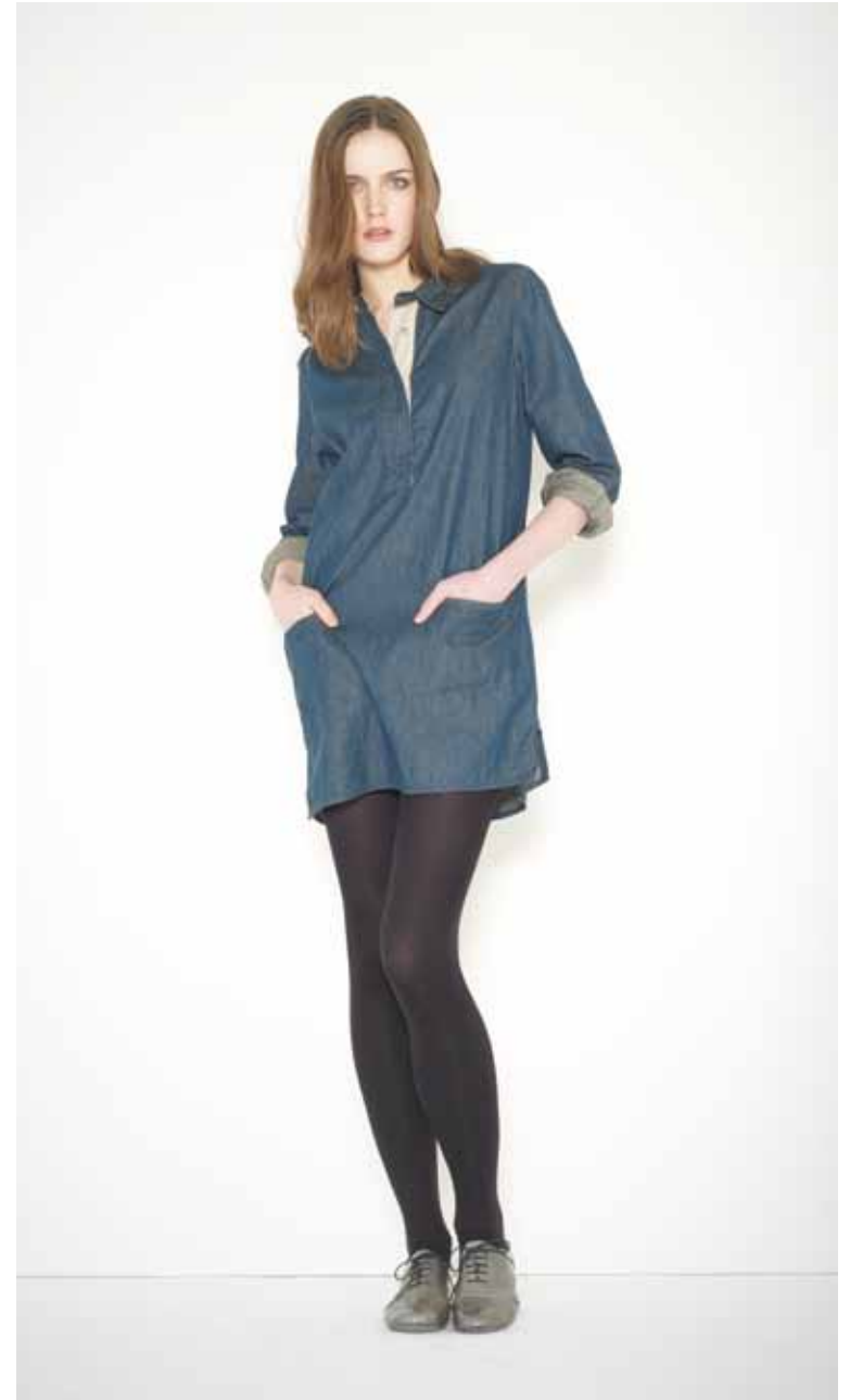
Robe Irene en denim - Irene denim dress 11