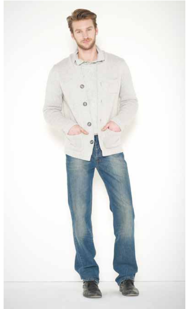
Veste Ferre en laine & coton - Ferre cotton & wool jacket Pull Simiot en shetland & cachemire - Simiot cashmere & shetland wool jumper Polo Pewter en coton - Pewter cotton polo Jeans Destroy en denim used - Destroy used denim jeans