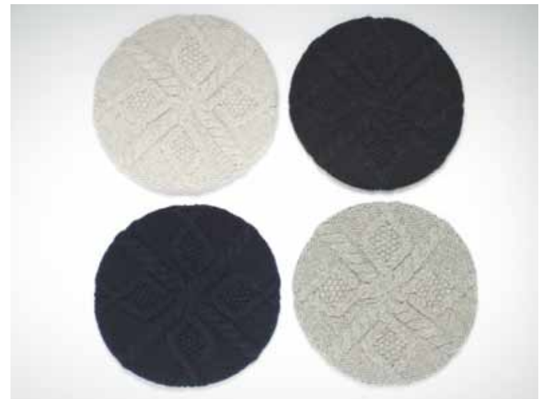
Bérets Casino en cachemire - Casino cashmere berets 2