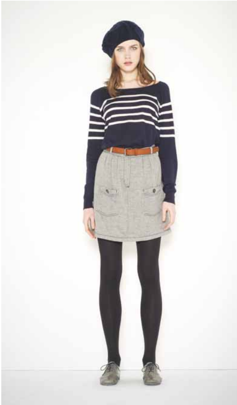
6 Marinière Eugène en cachemire & coton - Eugène cashmere & cotton marinière Jupe Célia en chambray - Célia chambray skirt Béret Casino en cachemire - Casino cashmere beret Ceinture Beckett en cuir - Beckett leather belt