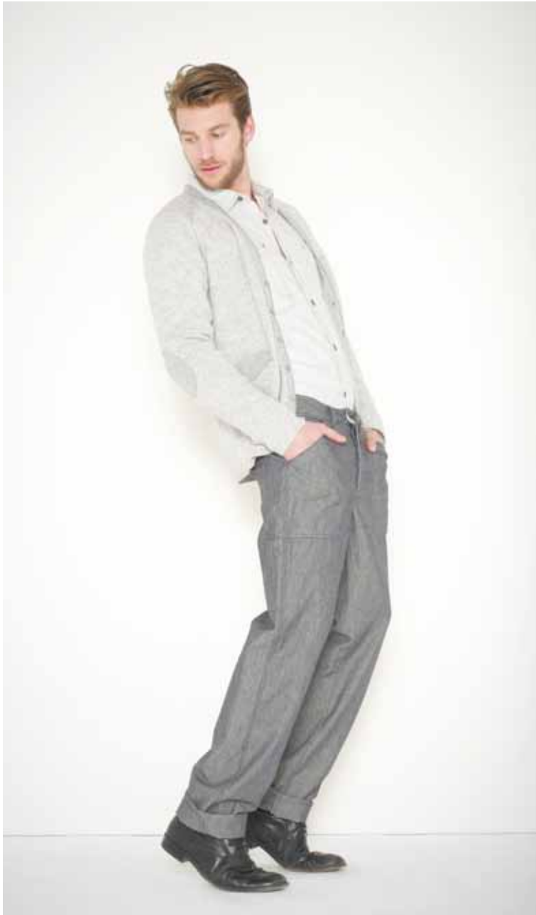
34 Cardigan Wilson en laine mélangée - Wilson melanged wool cardigan Chemise Coburn en coton - Coburn cotton shirt Pantalon Carpenter en chambray - Carpenter chambray trousers