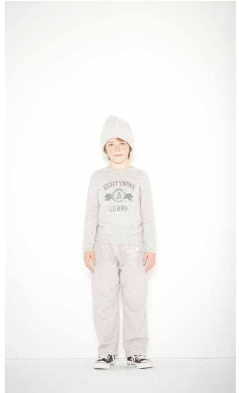
Pull Wilson en laine mélangée - Wilson melanged wool jumper Jogging Drieux en molleton - Drieux French Terry cotton jogging Bonnet Casino en cachemire - Casino cashmere cap