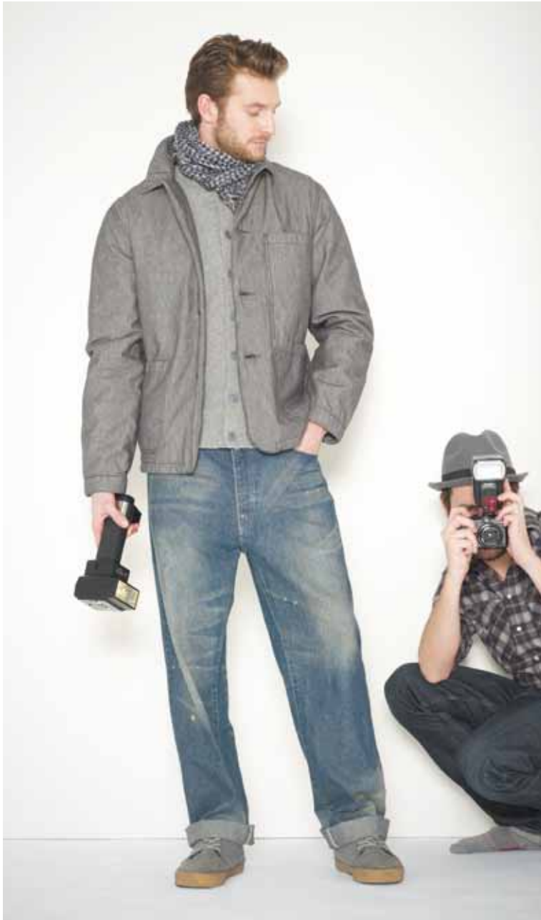
26 Veste Frédéric en chambray - Frédéric chambray jacket Veste Georges en geelong - Georges geelong lambswool jacket Jeans Pierre en denim used - Pierre used denim jeans Chèche Pau en coton - Pau cotton scarf