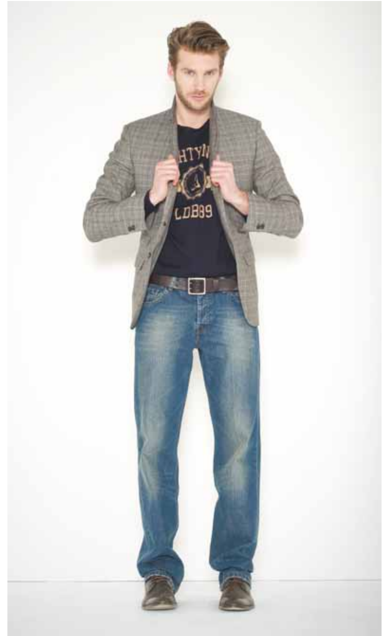
Veste Victor en laine - Victor wool jacket Pull Alphonse en cachemire - Alphonse cashmere jumper Jeans Destroy en denim used - Destroy used denim jeans Ceinture Calet en cuir gravé - Calet engraved leather belt