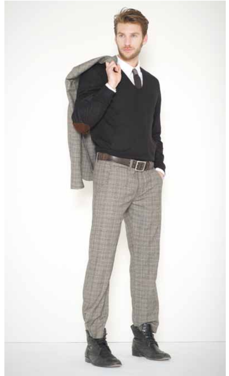
Veste Victor en laine - Victor wool jacket Pull Eugène en cachemire & coton - Eugène cotton & cashmere jumper Chemise Arthur en coton - Arthur cotton shirt / Cravate Curtis en soie - Curtis silk tie Pantalon Chazal en laine - Chazal wool trousers Ceinture Calet en cuir gravé - Calet engraved leather belt