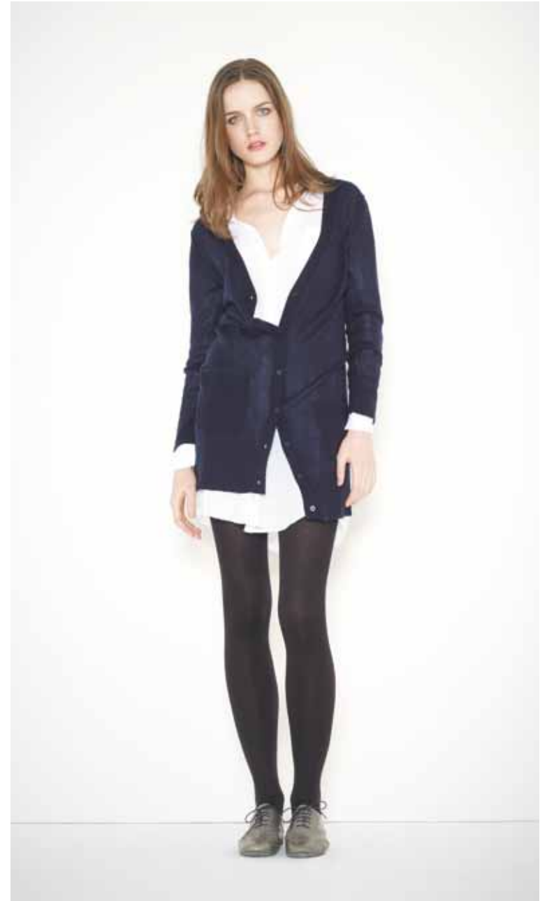
Cardigan Simone en cachemire & soie - Simone silk & cashemire cardigan Robe chemise Charles en coton - Charles cotton shirt dress