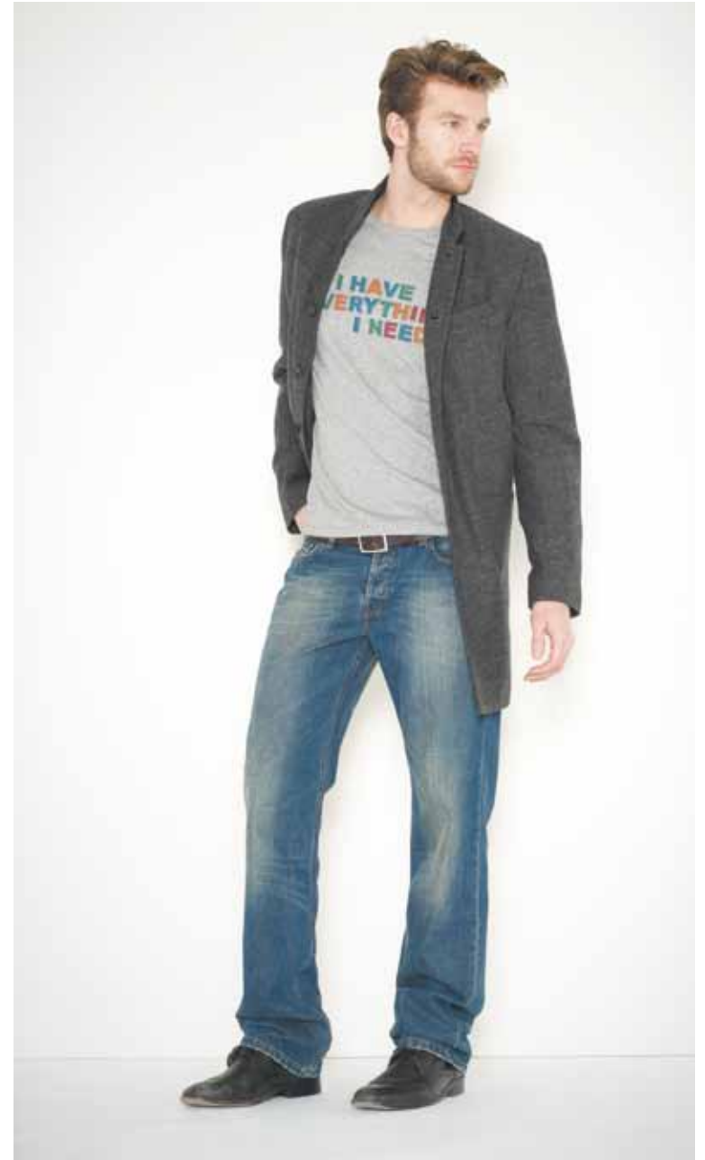
Manteau Meray en laine - Meray wool coat T-shirt Need en coton imprimé - Need printed cotton t-shirt Jeans Destroy en denim used - Destroy used denim jeans Ceinture Calet en cuir gravé - Calet engraved leather belt