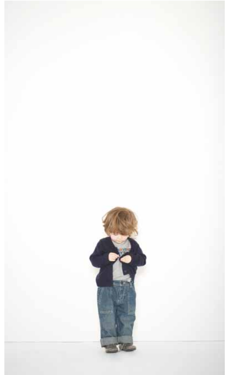
Cardigan Simone en cachemire & soie - Simone cashmere & silk cardigan T-shirt Need en coton imprimé - Need printed cotton t-shirt Jeans Romain en denim used - Romain used denim jeans