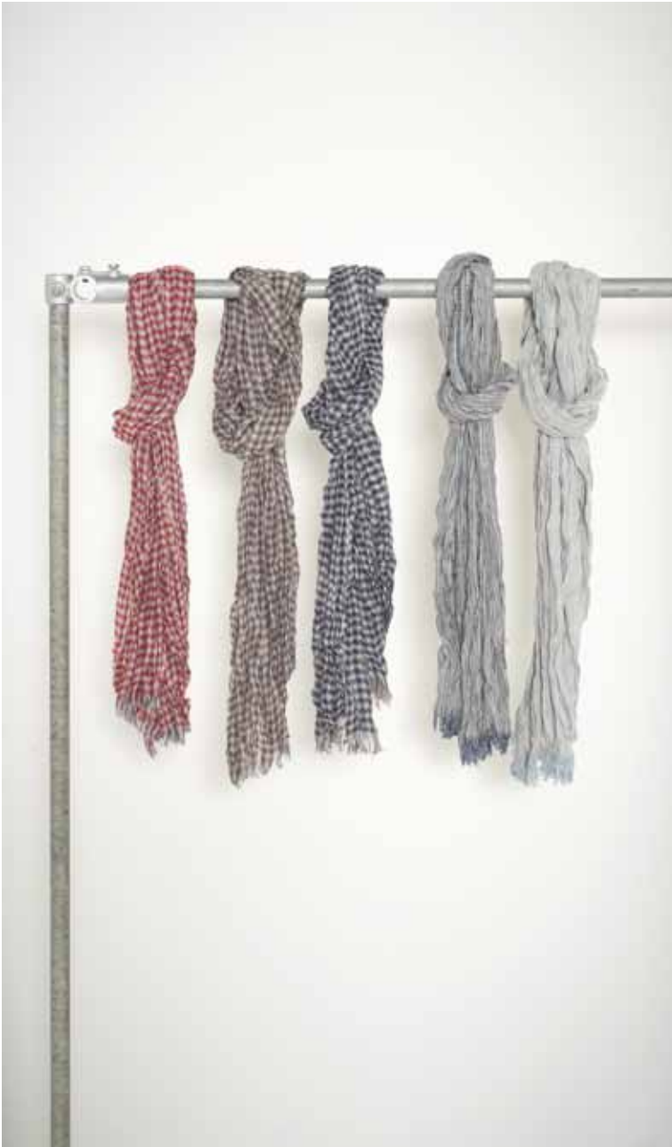
7 Chèches en laine froissée - Teared wool scarves