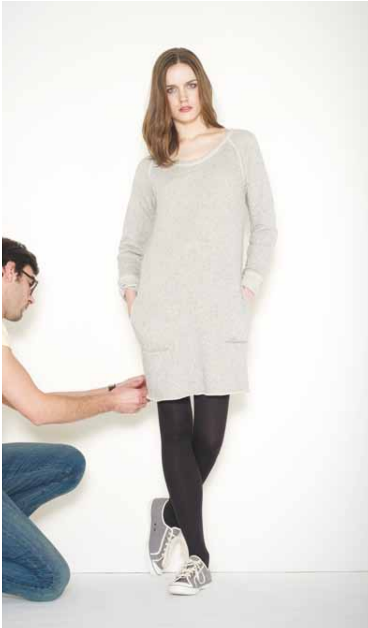
12 Robe Drieux en molleton - Drieux French Terry cotton dress Baskets Run en chambray - Run chambray trainers