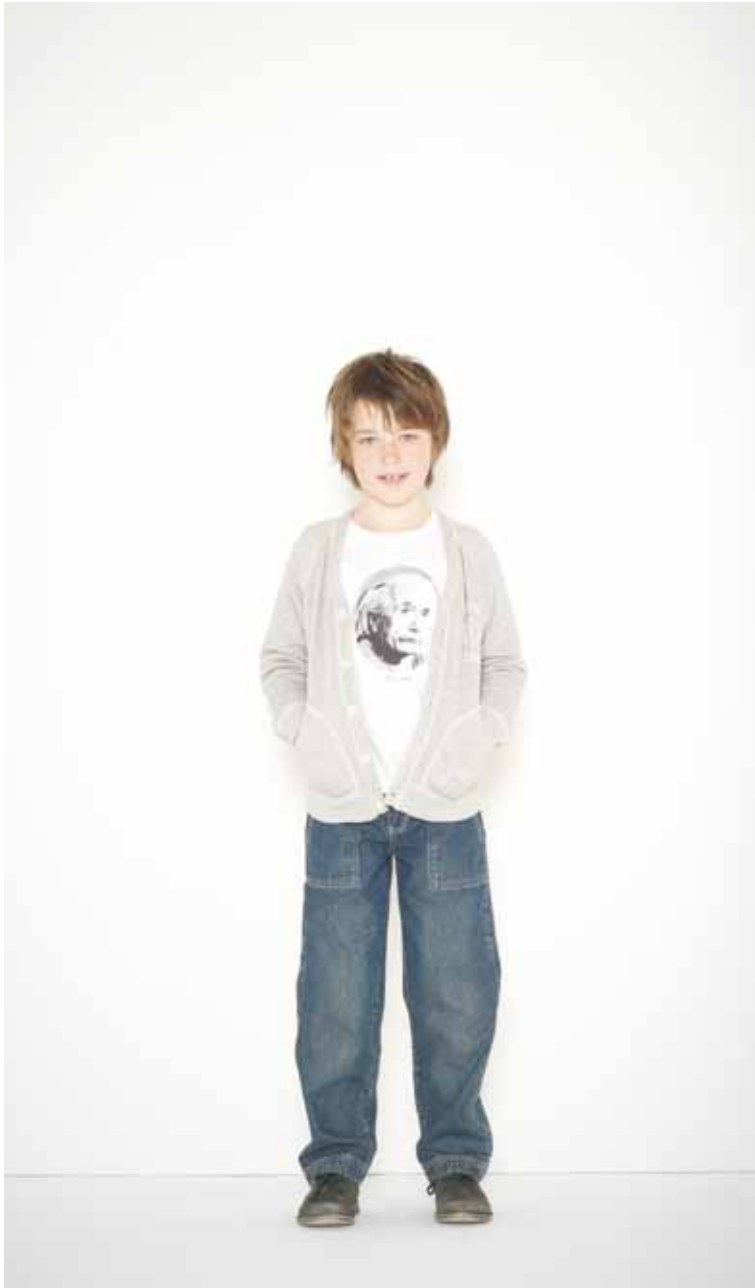
45 Cardigan Drieux en molleton - Drieux French Terry cotton cardigan T-shirt Einstein en coton imprimé - Einstein printed cotton t-shirt Jeans Romain en denim used - Romain used denim jeans