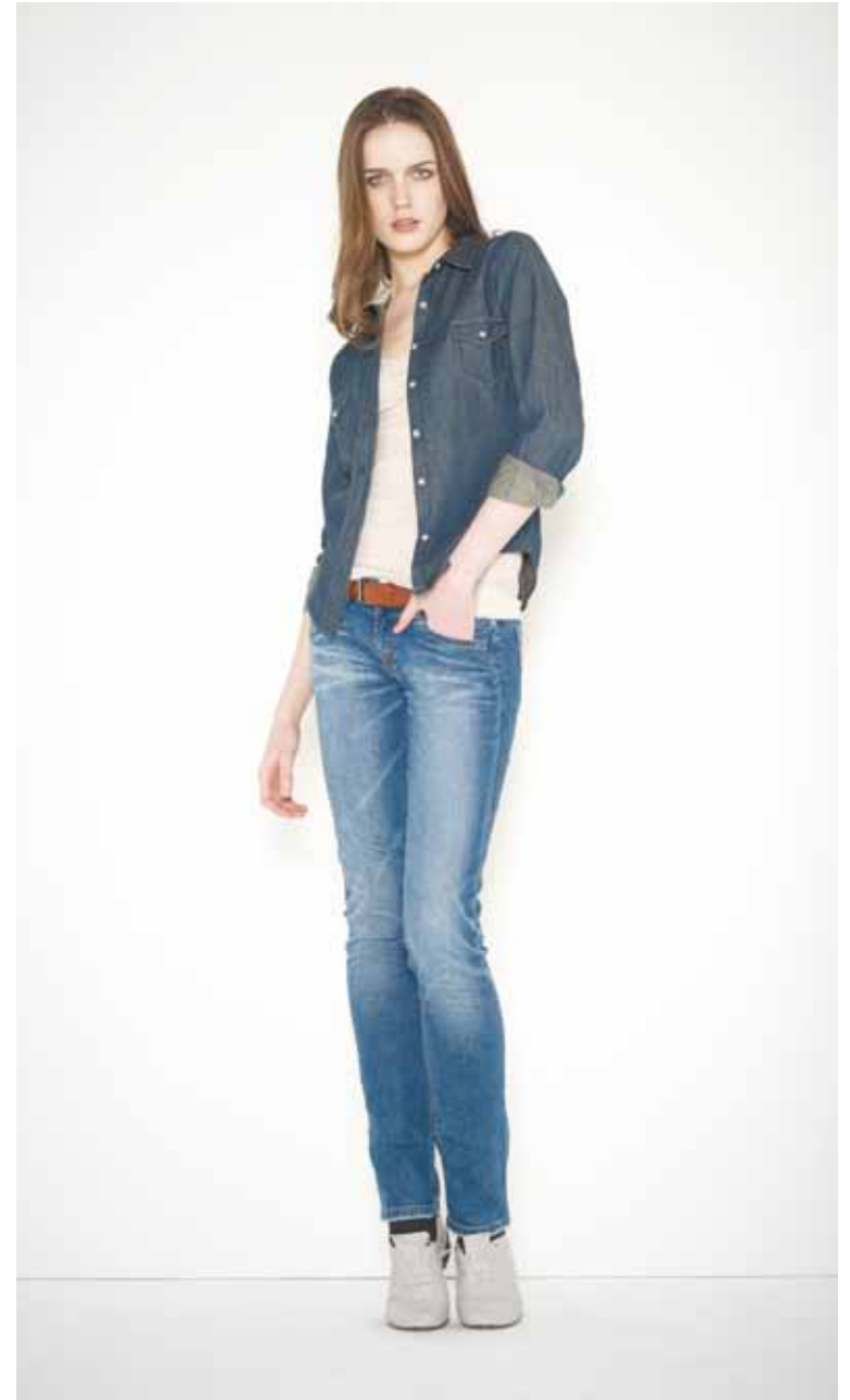
Chemise Chantal en denim - Chantal denim shirt Débardeur Moma en coton - Moma cotton tank Jeans Boy Slim en denim used - Boy Slim used denim jeans Ceinture Beckett en cuir - Beckett leather belt