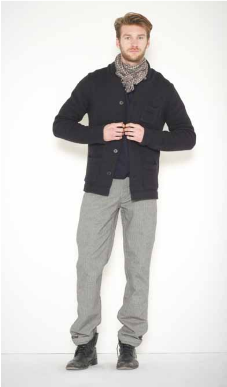
36 Veste Ferre en laine & coton - Ferre cotton & wool jacket Pull Eugène en cachemire & coton - Eugène cashmere & cotton jumper Pantalon Henry en chambray - Henry chambray trousers Chèche Pau en laine - Pau wool scarf