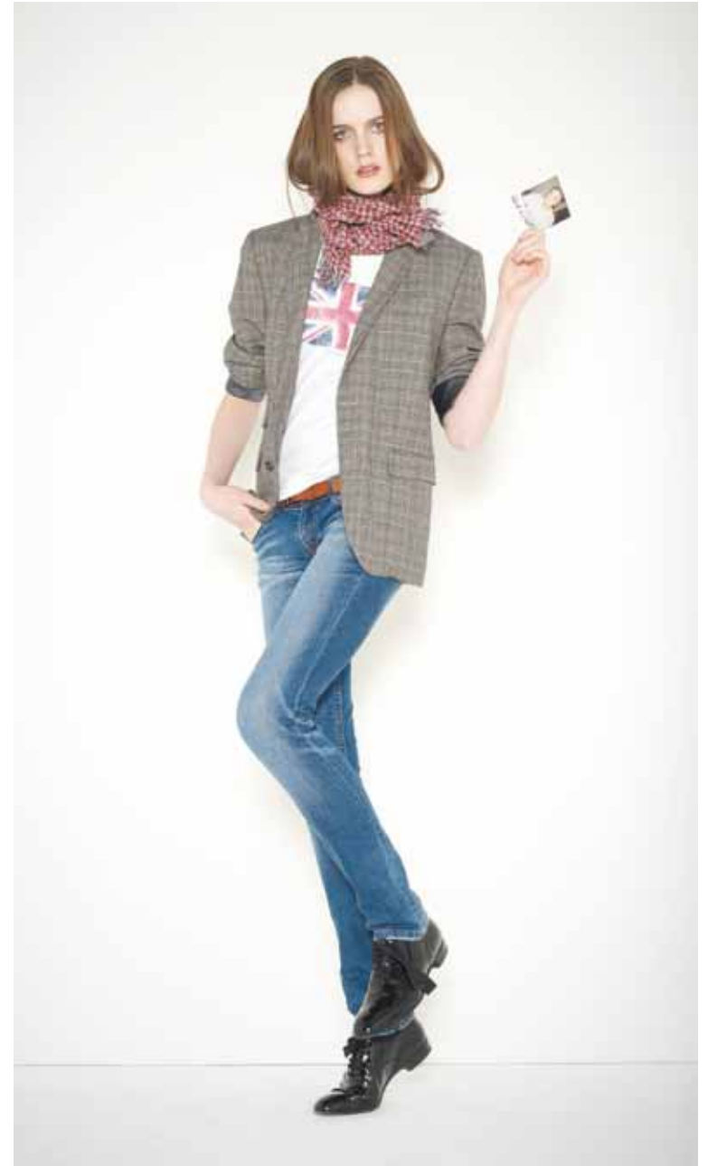
Veste Victor en laine - Victor wool jacket T-shirt Union Jack en coton imprimé - Union jack printed cotton t-shirt Jeans Boy Slim en denim used - Boy Slim used denim jeans Chèche Pau en coton - Pau cotton scarf