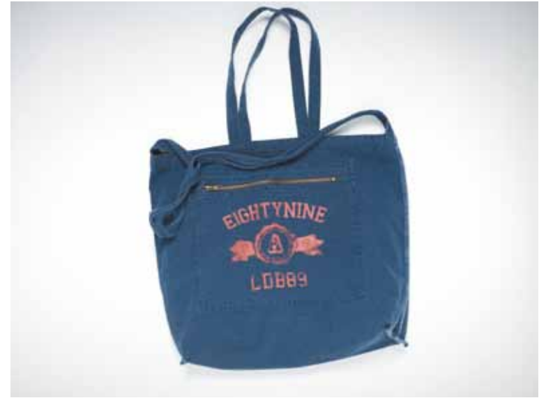
Sacs Freedom en toile - Freedom canvas bags 4