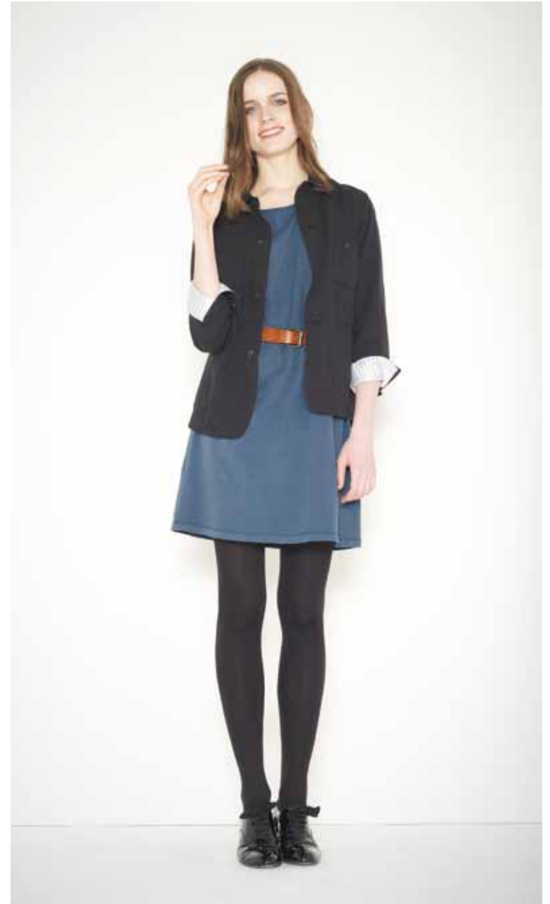
Veste Prévert workwear en coton - Prévert cotton workwear jacket Robe Flaubert en jersey - Flaubert jersey dress Ceinture Beckett en cuir - Beckett leather belt