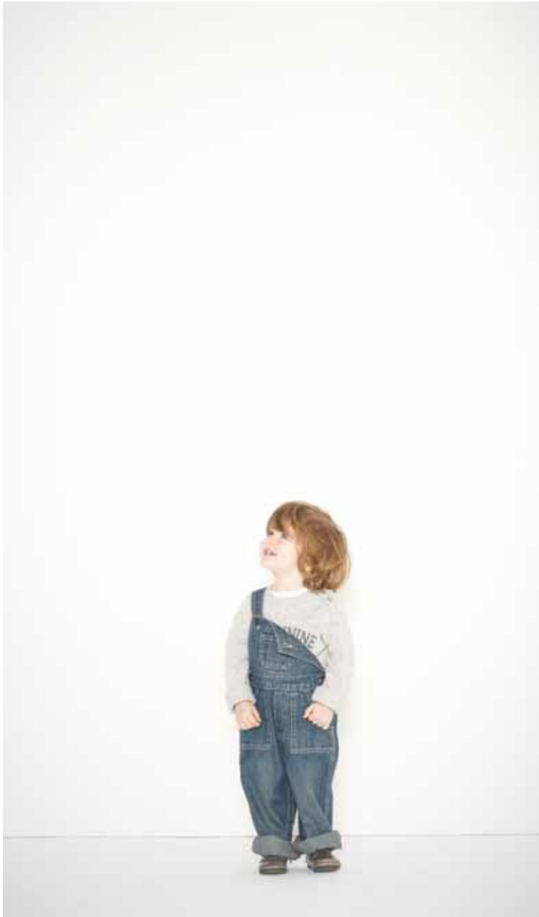
51 Salopette Julie en denim used - Julie used denim dungarees Pull Wilson en laine mélangée - Wilson melanged wool jumper