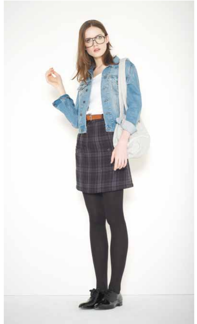
Veste Old School en denim used - Old School used denim jacket T-shirt Flaubert en coton - Flaubert cotton t-shirt Jupe Célia en coton - Célia cotton skirt Ceinture Beckett en cuir - Beckett leather belt Sac Salomon en molleton - Salomon French Terry cotton bag