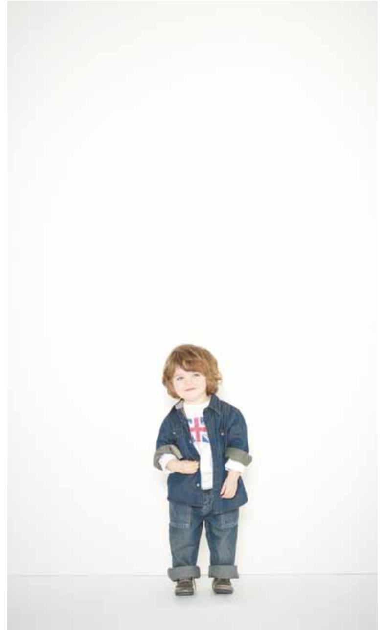
Chemise Follain en coton - Follain cotton shirt T-shirt Union Jack en coton imprimé - Union Jack printed cotton t-shirt Jeans Romain en denim used - Romain used denim jeans