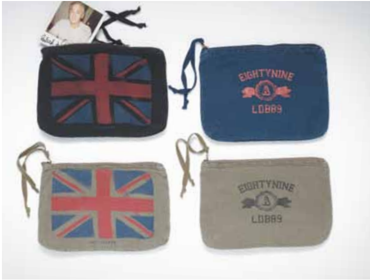
3 Pochettes Freedom en toile - Freedom canvas purse