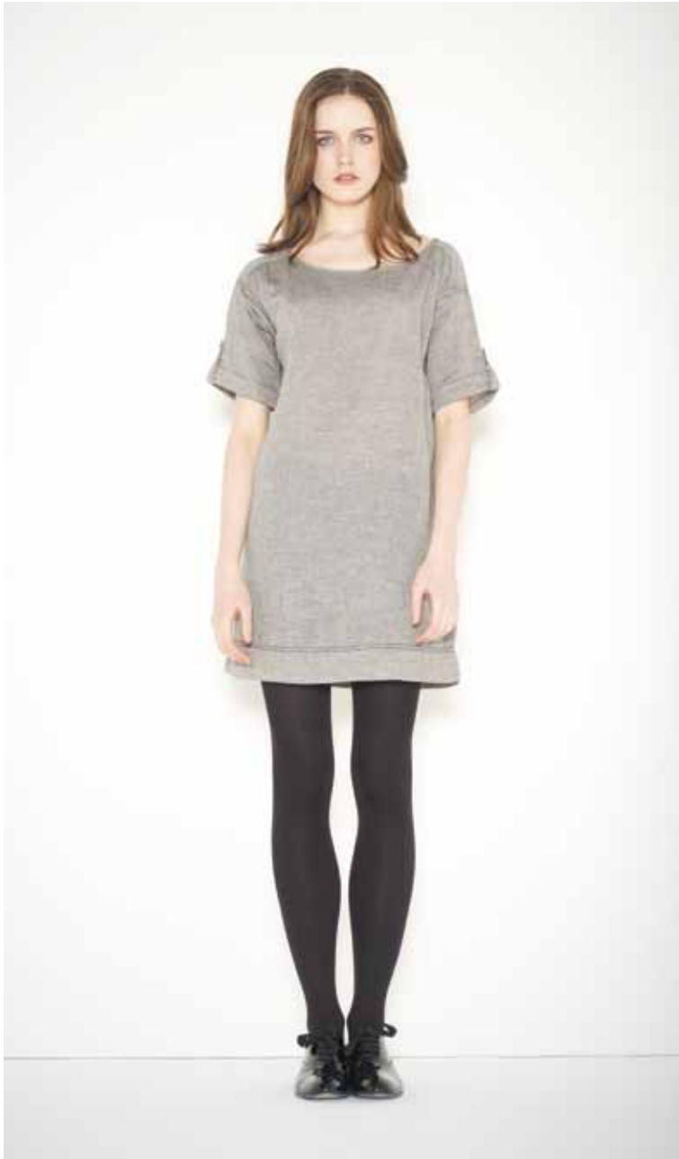
8 Robe Daniel en chambray - Daniel chambray dress