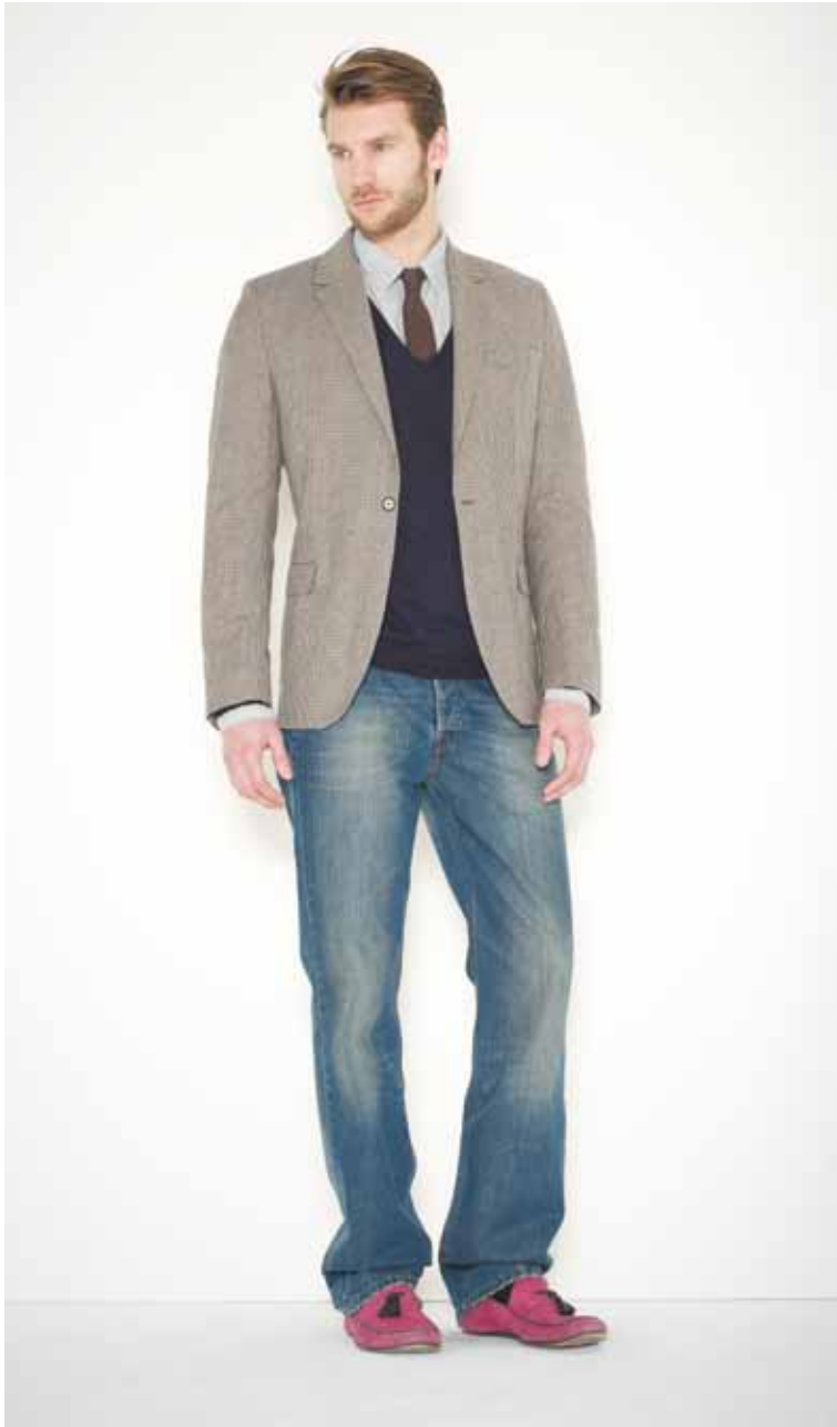
22 Veste Victor en laine - Victor wool jacket Pull Eugène en cachemire & coton - Eugène cotton & cashmere jumper Chemise Berry en coton - Berry cotton shirt Jeans Destroy en denim used - Destroy used denim jeans Cravate Loft en soie - Loft silk tie