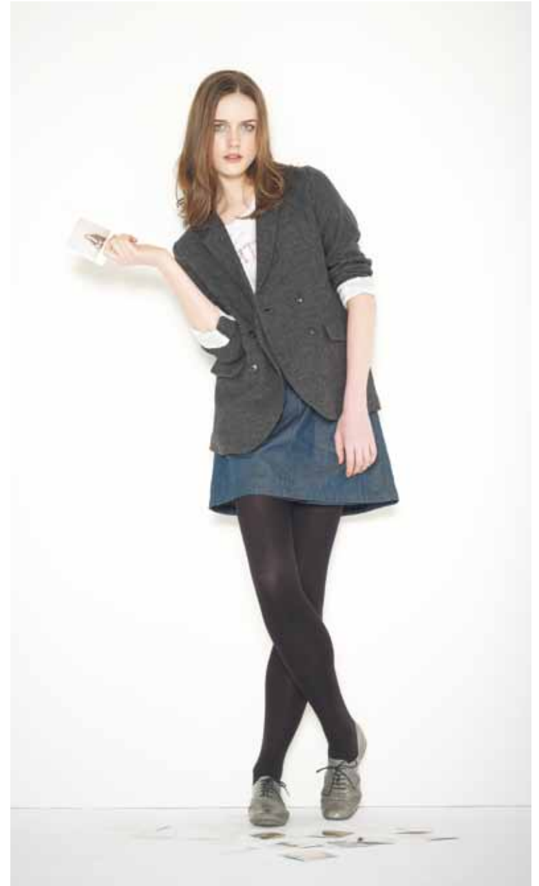
Veste Beauvoir en laine - Beauvoir wool jacket T-shirt College en coton imprimé - College printed cotton t-shirt Jupe Célia en denim - Célia denim skirt