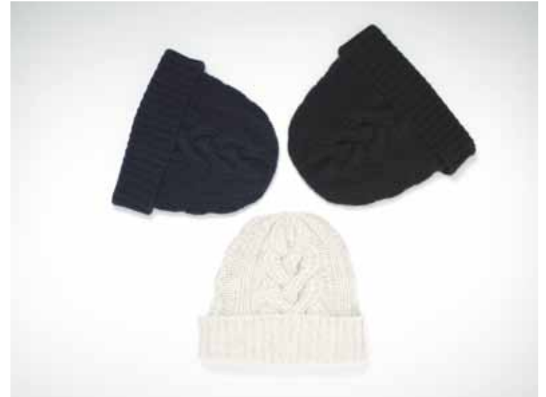
Bonnets Casino en cachemire - Casino cashmere caps 1