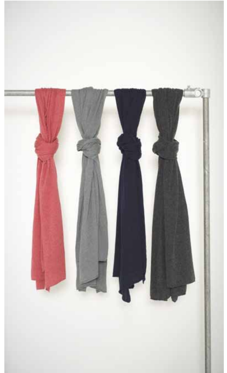
Echarpes Simone en cachemire & soie - Simone cashmere & silk scarves 8