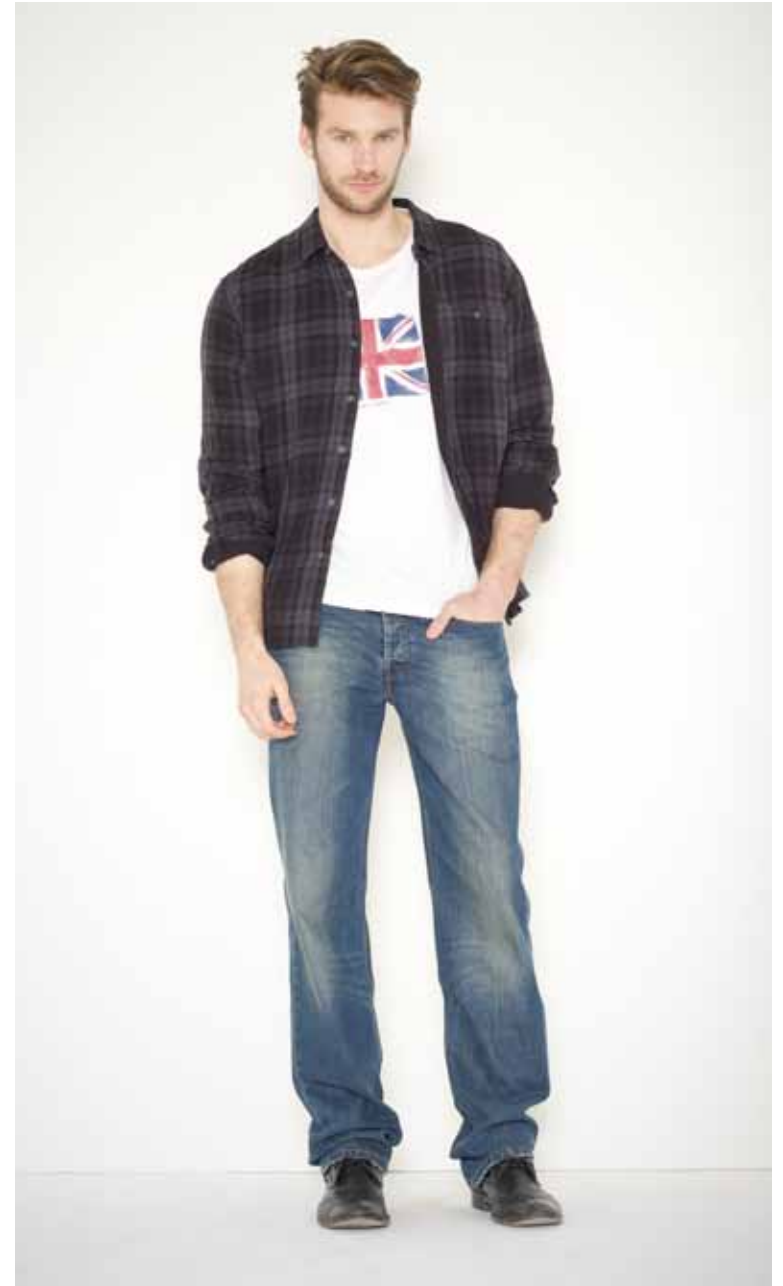
Chemise Corneille en coton double face - Corneille double face cotton shirt T-shirt Union Jack en coton imprimé - Union Jack printed cotton t-shirt Jeans Destroy en denim used - Destroy used denim jeans