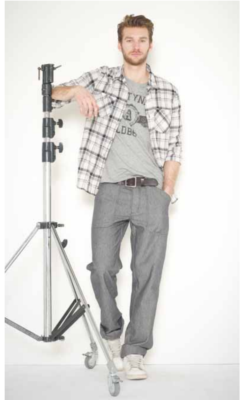
Chemise Aragon en coton - Aragon cotton shirt T-shirt College en coton imprimé - College printed cotton t-shirt Pantalon Carpenter en chambray - Carpenter chambray trousers Ceinture Calet en cuir gravé - Calet engraved leather belt