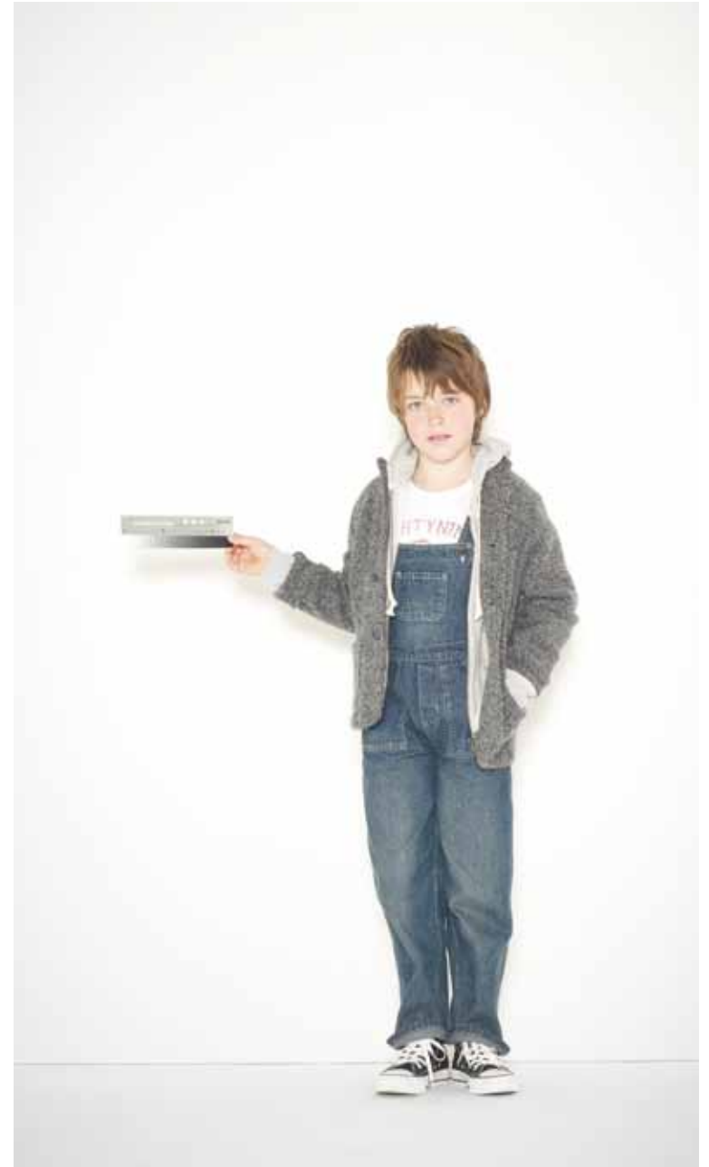
Veste Work en laine bouillie - Work boiled wool jacket Sweat Drieux en molleton - Drieux French Terry cotton sweat shirt T-shirt College en coton imprimé - College printed cotton t-shirt Salopette Julie en denim used - Julie used denim dungarees