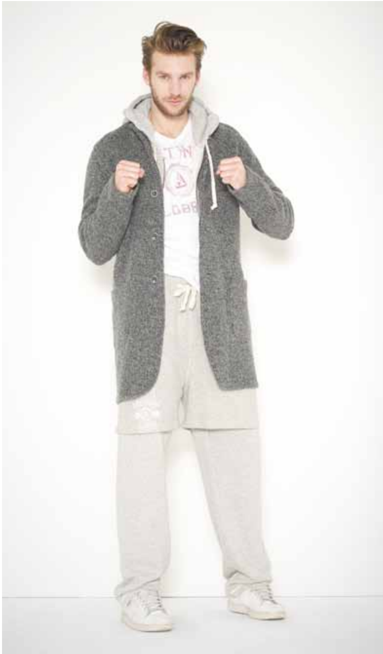
32 Manteau Work en laine bouillie - Work boiled wool coat Sweat Drieux en molleton - Drieux French Terry cotton sweat shirt T-shirt College en coton imprimé - College printed cotton t-shirt Short & Jogging Drieux en molleton - Drieux French Terry cotton shorts & jogging