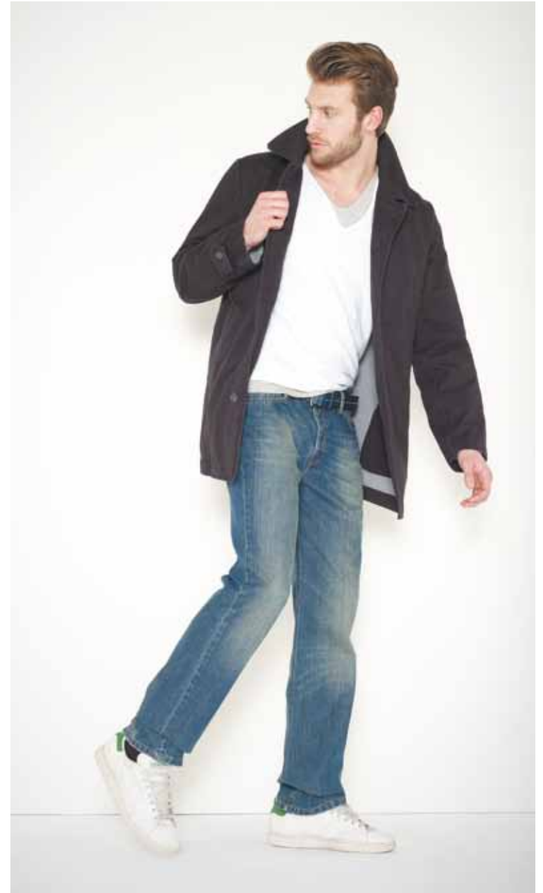
Trench Armand en coton - Armand cotton trench – coat T-shirt col V Pewter en coton - Pewter V neck cotton t-shirt T-shirt col V profond Milan en coton - Milan deep V neck cotton t-shirt Jeans Destroy en denim used - Destroy used denim jeans Ceinture Deniau en cuir - Deniau leather belt