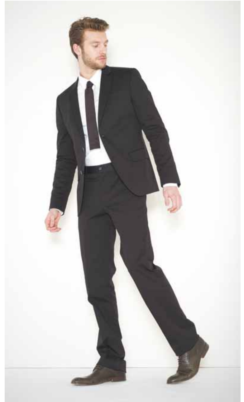
Costume Chazal en coton - Chazal cotton suit Chemise Arthur en coton - Arthur cotton shirt Cravate Loft en soie - Loft silk tie