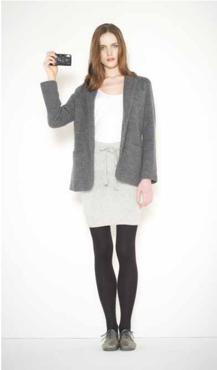
2 Veste Racine en mérinos - Racine merino wool jacket Débardeur Varenne en coton viscose flammé - Varenne slub cotton viscosis tank Jupe Simiot en shetland & cachemire - Simiot cashmere & shetland wool skirt