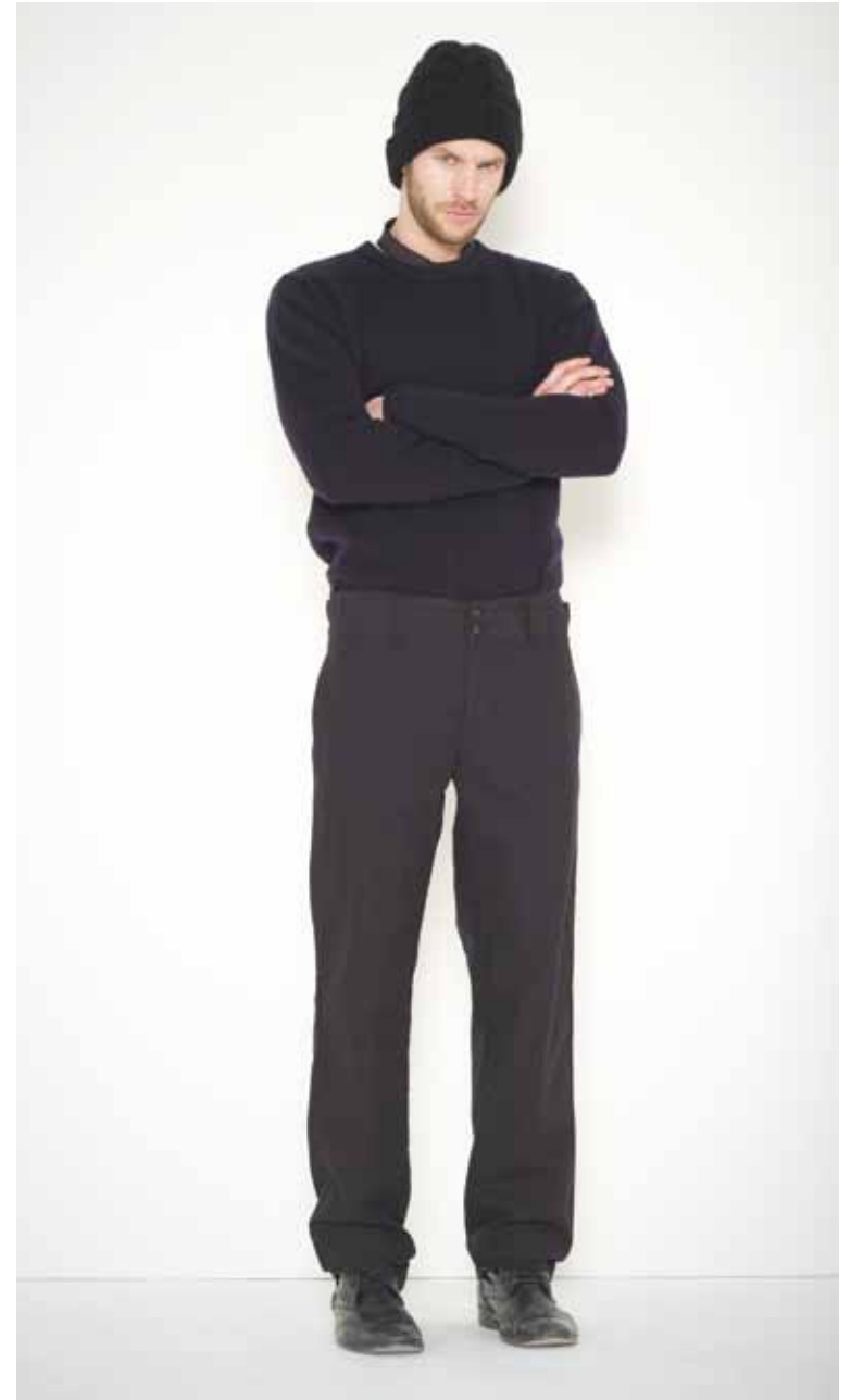
Pull Georges en geelong - Georges geelong lambswool jumper Pantalon Memphis en coton - Memphis cotton jumper Bonnet Casino en cachemire - Casino cashmere cap Cravate Loft en soie - Loft silk tie 29