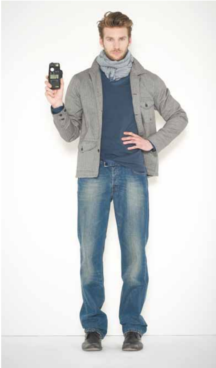
30 Veste Leon en chambray - Leon chambray jacket T-shirt Flaubert en coton surteint - Flaubert overdye cotton t-shirt Jeans Destroy en denim used - Destroy used denim jeans Chèche Phine en laine - Phine wool scarf