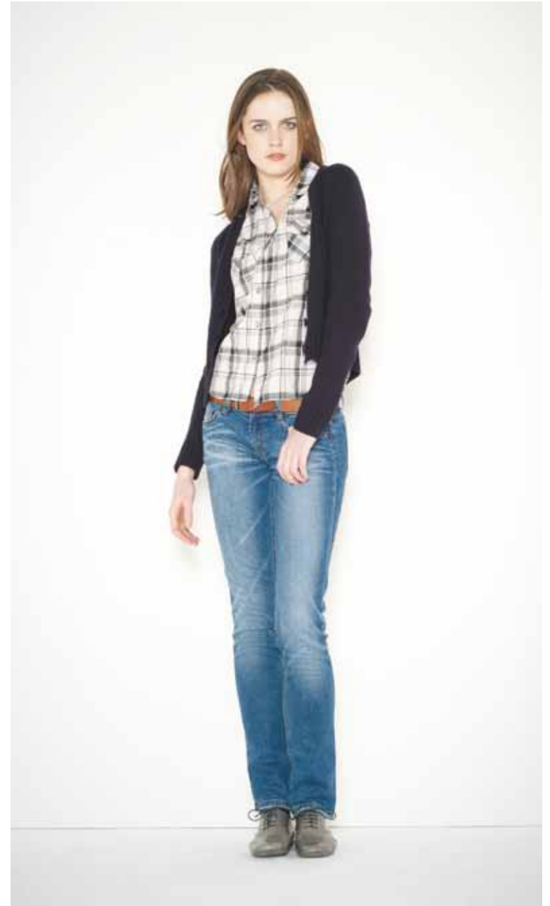
Cardigan Georges en geelong - Georges geelong lambswool cardigan Chemise Chantal en coton - Chantal cotton shirt Jeans Boy Slim en denim used - Boy Slim used denim jeans Ceinture Beckett en cuir - Beckett leather belt