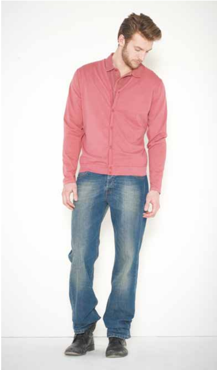
40 Cardigan Flaubert en coton surteint - Flaubert overdye cotton cardigan Polo Pewter en coton - Pewter cotton polo Jeans Destroy en denim used - Destroy used denim jeans