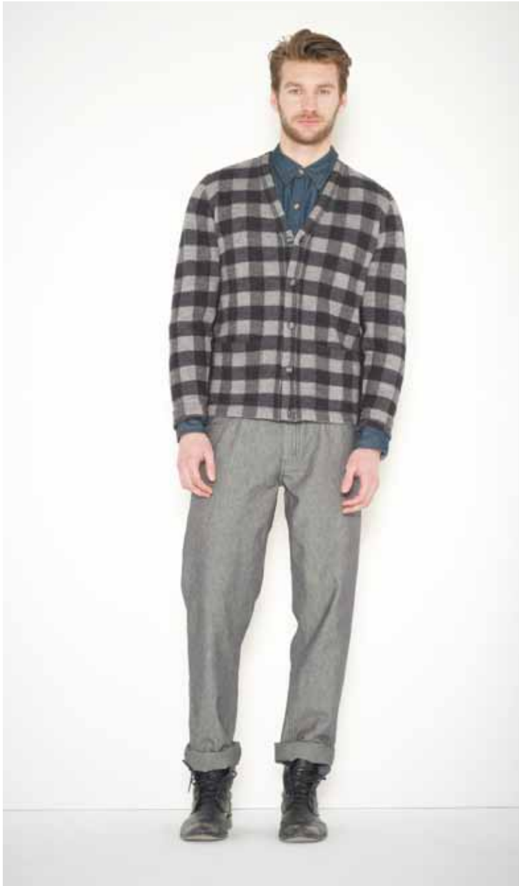
38 Cardigan Cocteau en mérinos - Cocteau wool merino cardigan Chemise Coburn en denim - Coburn denim shirt Pantalon Henry en chambray - Henry chambray trousers Ceinture Calet en cuir - Calet leather belt