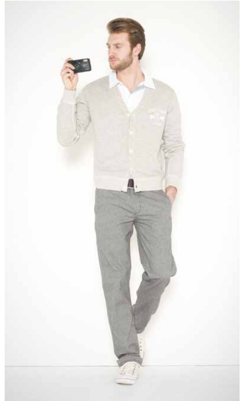
Cardigan Drieux en molleton - Drieux French Terry cotton cardigan Polo Flaubert en coton - Flaubert cotton polo Pantalon Vincent à chevrons - Vincent chevron trousers Ceinture Calet en cuir gravé - Calet engraved leather belt 25