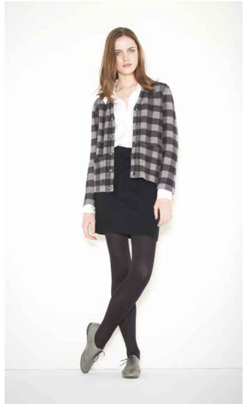
Cardigan Cocteau en mérinos - Cocteau wool merino cardigan Chemise Charles en coton - Charles cotton shirt Jupe Simiot en shetland & cachemire - Simiot cashmere & shetland wool skirt