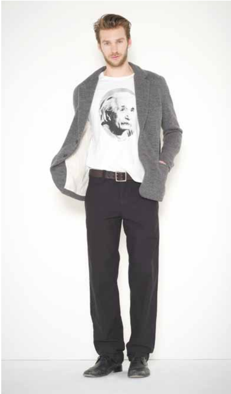
28 Veste Racine en laine - Racine wool jacket T-shirt Einstein en coton imprimé - Einstein printed cotton t-shirt Pantalon Memphis en coton - Memphis cotton trousers Ceinture Calet en cuir gravé - Calet engraved leather belt