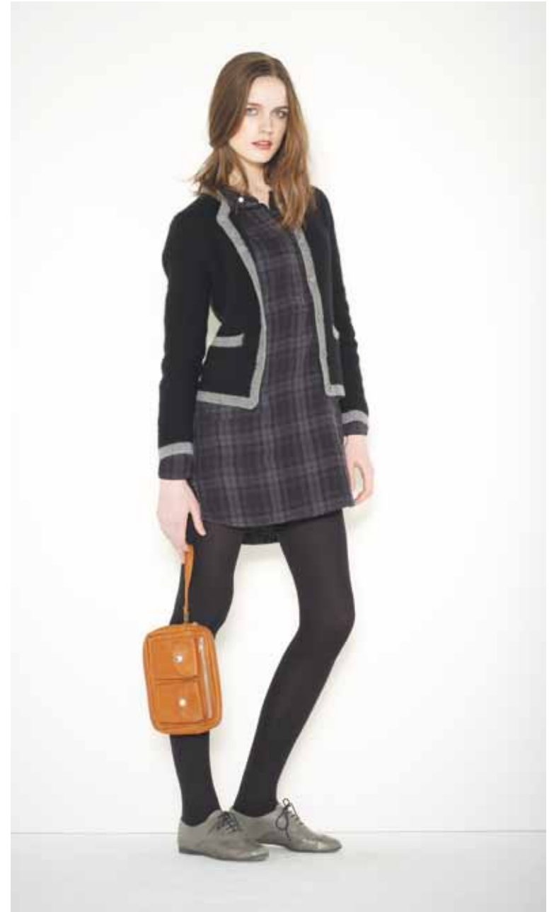
Veste Casino en cachemire - Casino cashmere jacket Robe Irene en coton - Irene cotton dress Pochette Gilson en cuir vintage - Gilson vintage leather purse