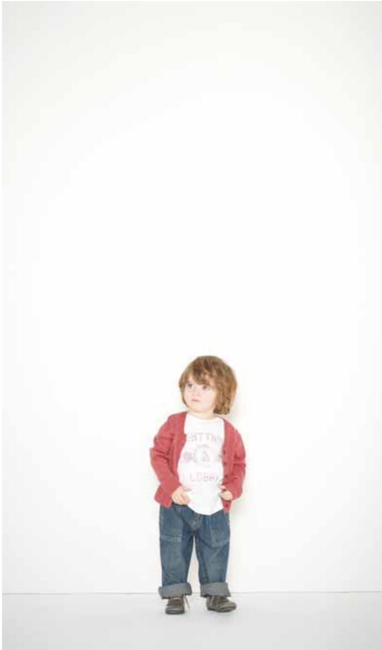
49 Cardigan Simone en cachemire & soie - Simone cashmere & silk cardigan T-shirt College en coton imprimé - College printed cotton t-shirt Jeans Romain en denim used - Romain used denim jeans